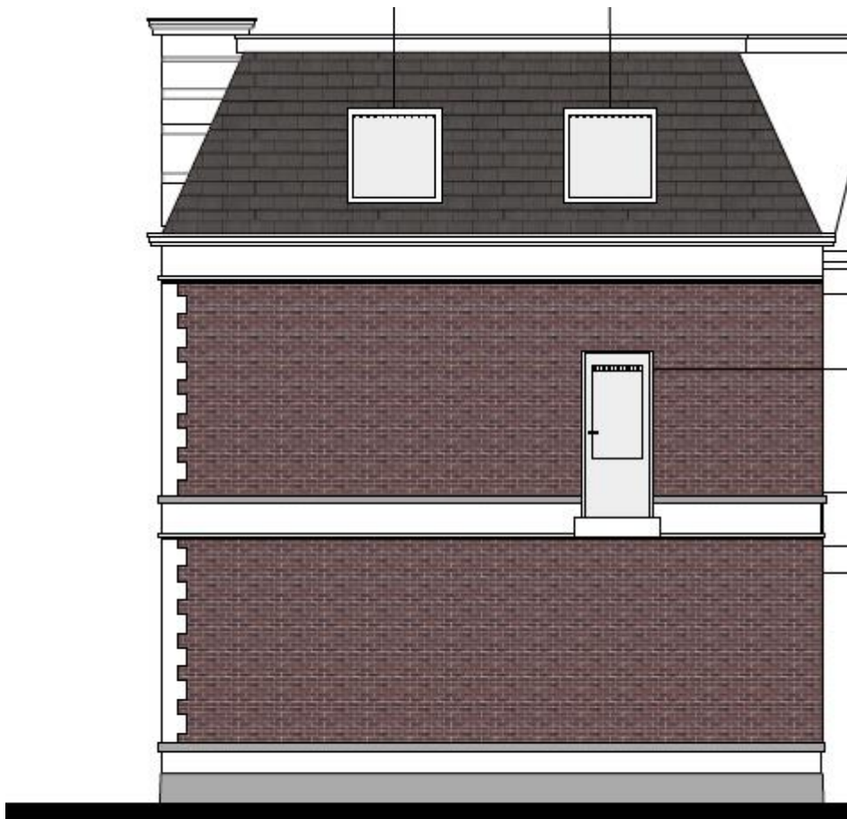
OOST GEVEL nieuw