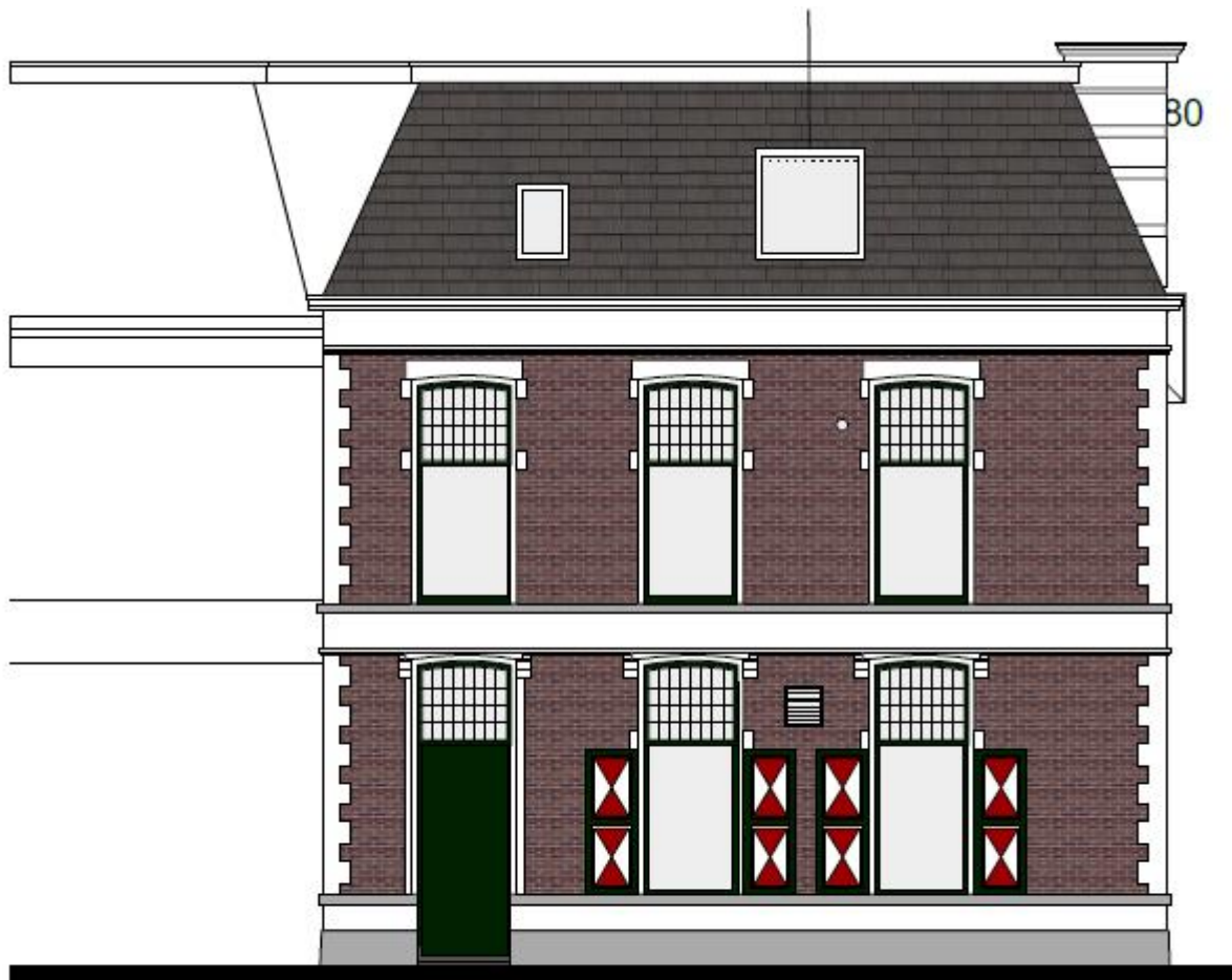
WEST GEVEL nieuw