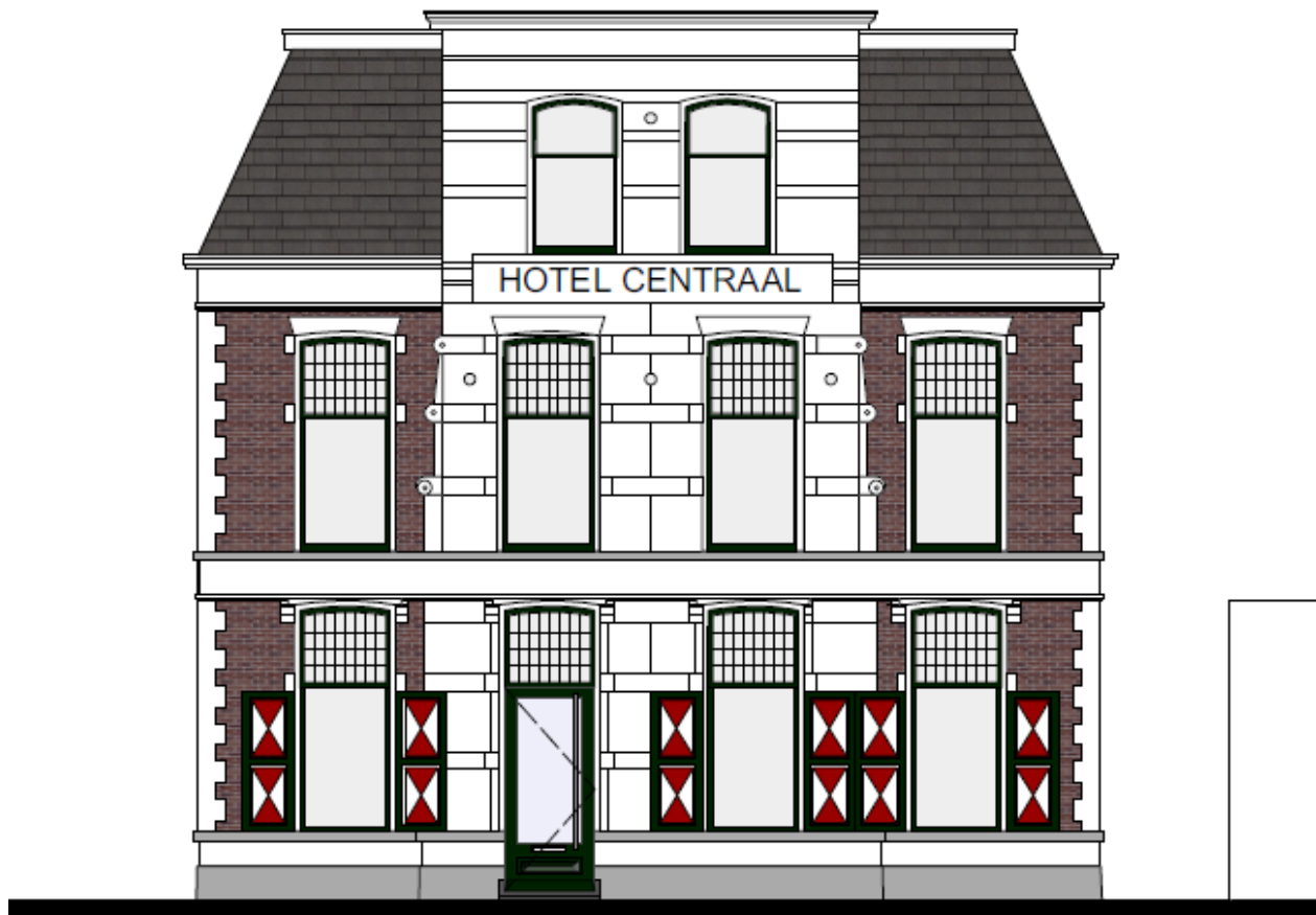
ZUID GEVEL nieuw